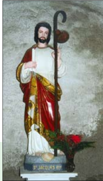
Cassaber, St. Jacques

Aan de overzijde van de Adour wacht een heel ander landschap. We krijgen weer heuvels en de dennenbossen maken plaats voor weiden en loofbossen. Vanaf Dax volgt bij St.Pandelon