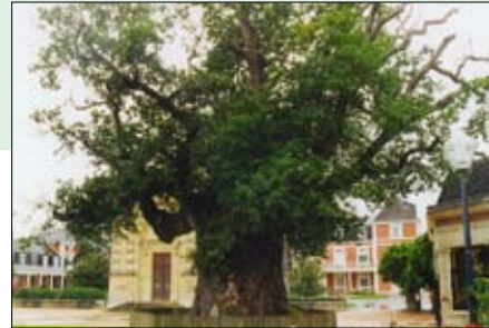
Berceau de St. Vincent-de-Paul, 600 jaar oude eik