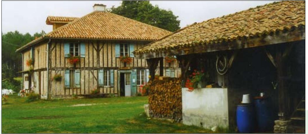
hoeve in Les Landes

km 148 In Berceau de St.Vincent-de-Paul bevindt zich een groot kloostercomplex met kerk en school rond de gerestaureerde boerenhoeve waar in 1581 St.Vincent-de-Paul geboren is. Hij was in zijn tijd een soort Abbé Pierre, die veel gedaan heeft voor de arme bevolking. Zijn geboortehuis is ingericht als museum. De zwaar ondersteunde monumentale eik op het pleintje is naar zeggen 600 jaar oud.